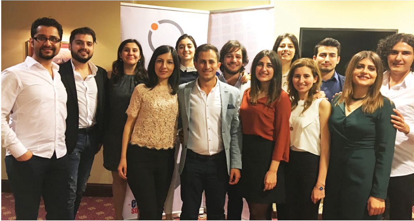
İlk Fırsat 2016 katılımcıları Mezunlar Buluşması'nda-27 Mayıs 2017