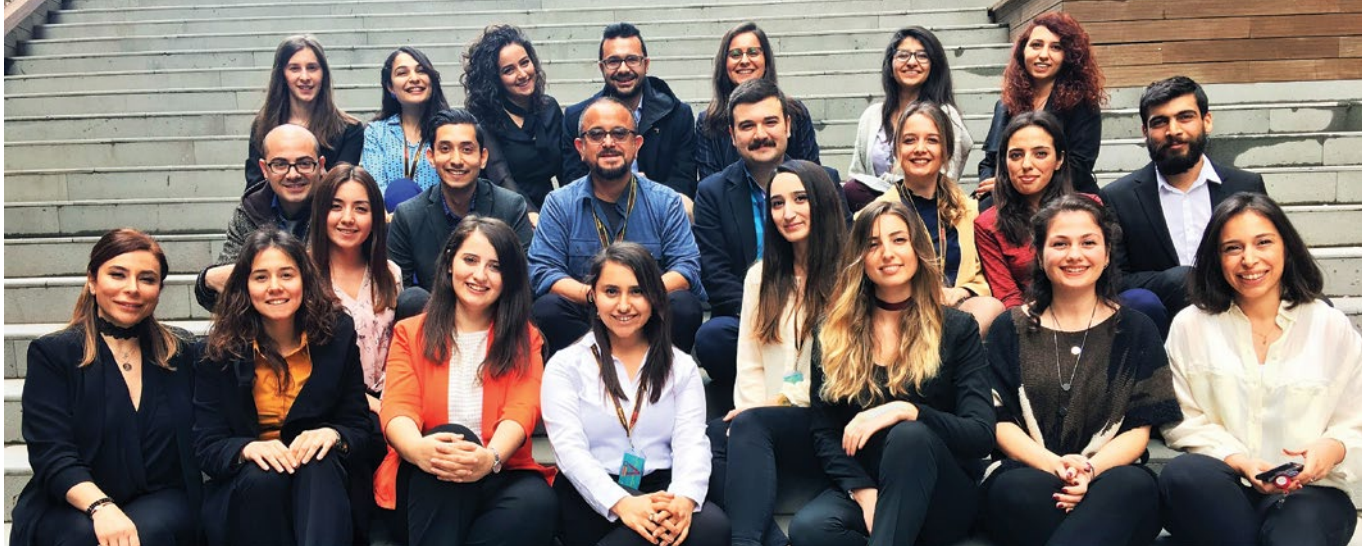
Pegasus Yönetim Kurulu Başkanı Ali Sabancı ile söyleşi, 24 Nisan 2017

Katılımcılar ve yöneticileri izleme değerlendirme çalışmaları kapsamında yılda üç kez hem iş deneyimleri hem de program hakkında geri bildirimlerini Esas Sosyal ekibiyle paylaşıyor.