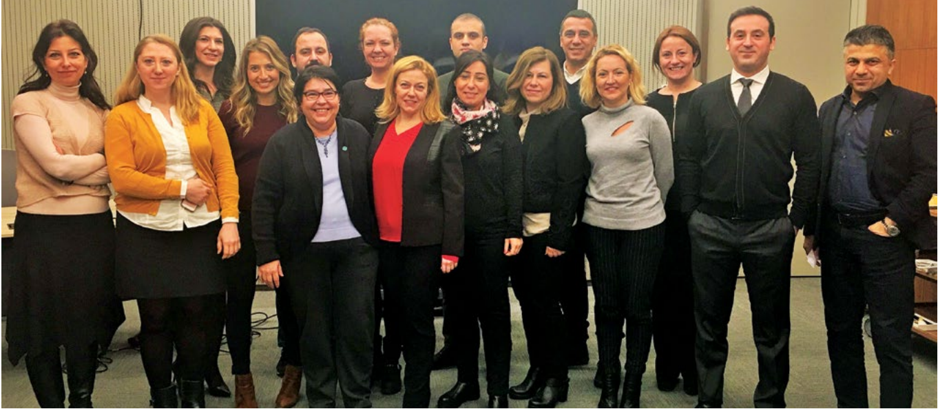
2017 Mentorluk Eğitimi, 16 Şubat 2017

Mentorluk süreci boyunca mentorlar ve katılımcılar, birlikte belirledikleri hedef planı çerçevesinde görüşmelerini gerçekleştiriyorlar. Mentorlar hem kariyer planlama hem de farklı kariyer alanları hakkında tavsiyelerde bulunuyor. 2016'dan bu yana 17 farklı sektör ve 47 kurumdan (özel sektör ve sivil toplum kuruluşları) toplamda 57 mentor gönüllü destek vermişlerdir.