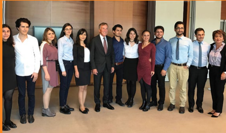
Eczacıbaşı Holding Yönetim Kurulu Başkanı Bülent Eczacıbaşı ile söyleşi, 1 Kasım 2016