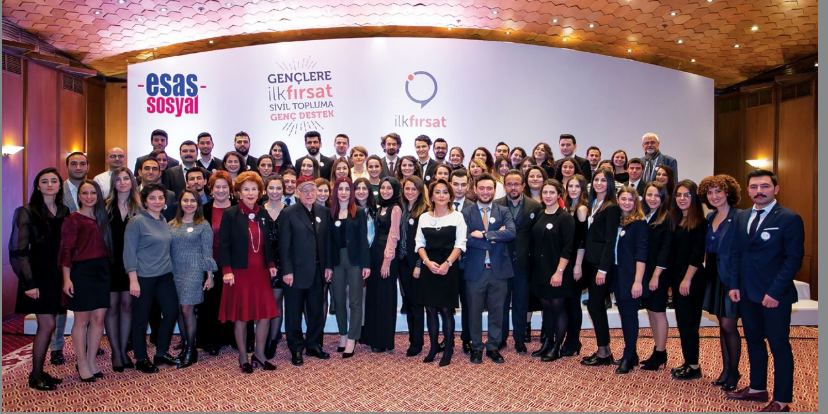
2016, 2017 ve 2018 katılımcıları Esas Sosyal Kurucular Kurulu, Danışma Kurulu ve Esas Sosyal Ekibi ile birlikte 2018 Dönem Açılışı, 18 Ocak 2018

Gençlerin geleceğe dair umutlarını destekleyerek Türkiye'nin geleceğine yatırım yapan İlk Fırsat büyük bir aile.