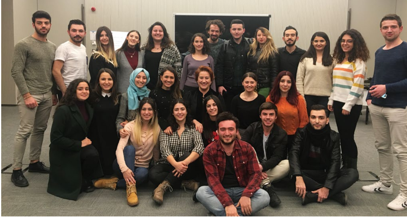
Etkili Sunum Becerileri Eğitimi, 11-12 Mart 2018