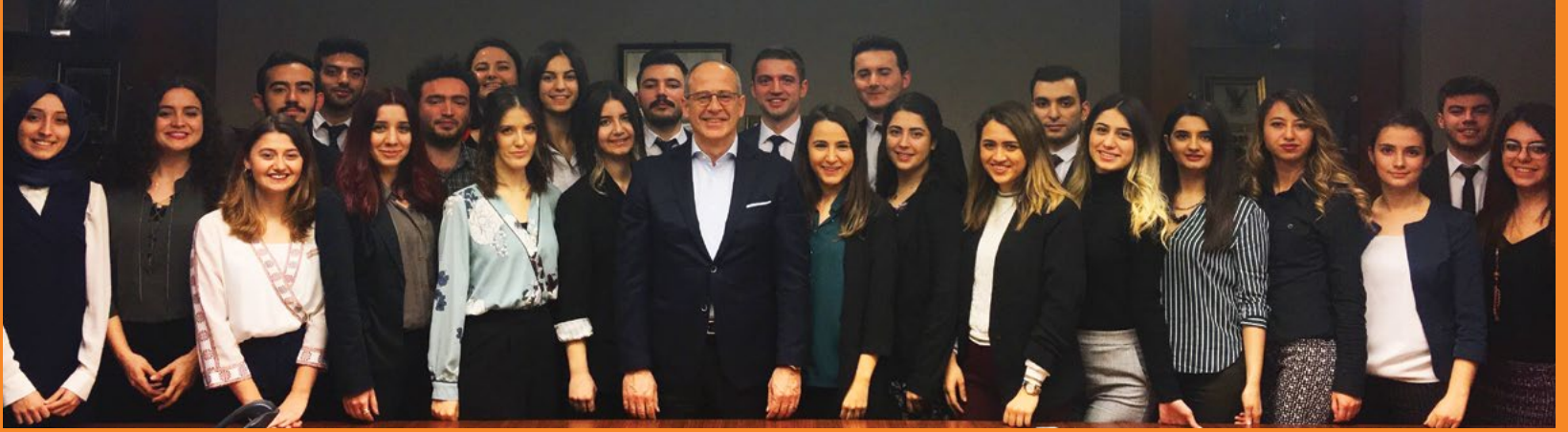
Coca-Cola International Eski Başkanı Ahmet Bozer ile söyleşi, 7 Mart 2018