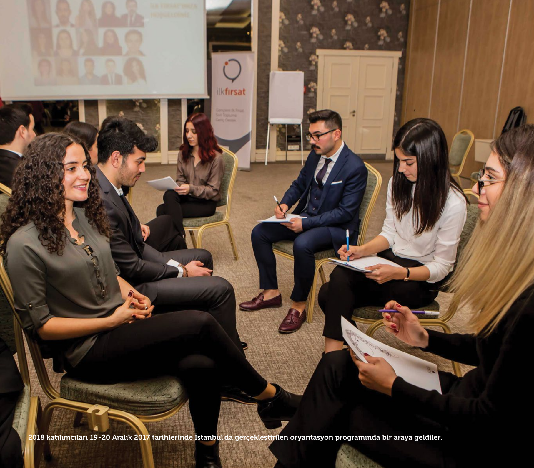
2018 katılımcıları 19-20 Aralık 2017 tarihlerinde İstanbul'da gerçekleştirilen oryantasyon programında bir araya geldiler.