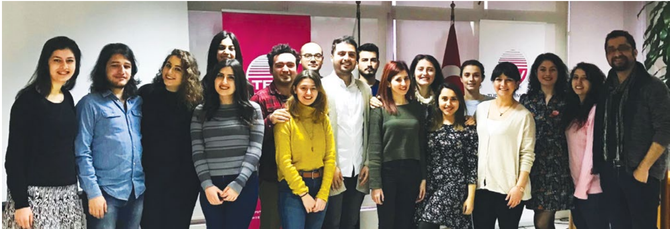
İlk Fırsat 2016-2018 katılımcıların Sektörel Bazlı Toplantı'da, 24 Şubat 2018

Sosyal etkinlikler kapsamında ise mezunlar, topluma geri verme misyonu ile İhtiyaç Haritası, KODA, Çorbadada Tuzun Olsun Derneği gibi sivil toplum kuruluşlarının faaliyetlerinin içinde yer alıyor. Ayrıca çalıştıkları kurumlarla Runatolia Antalya ve Avrasya Maratonu gibi platformlarda farkındalık çalışmalarında aktif olarak görev alıyorlar.